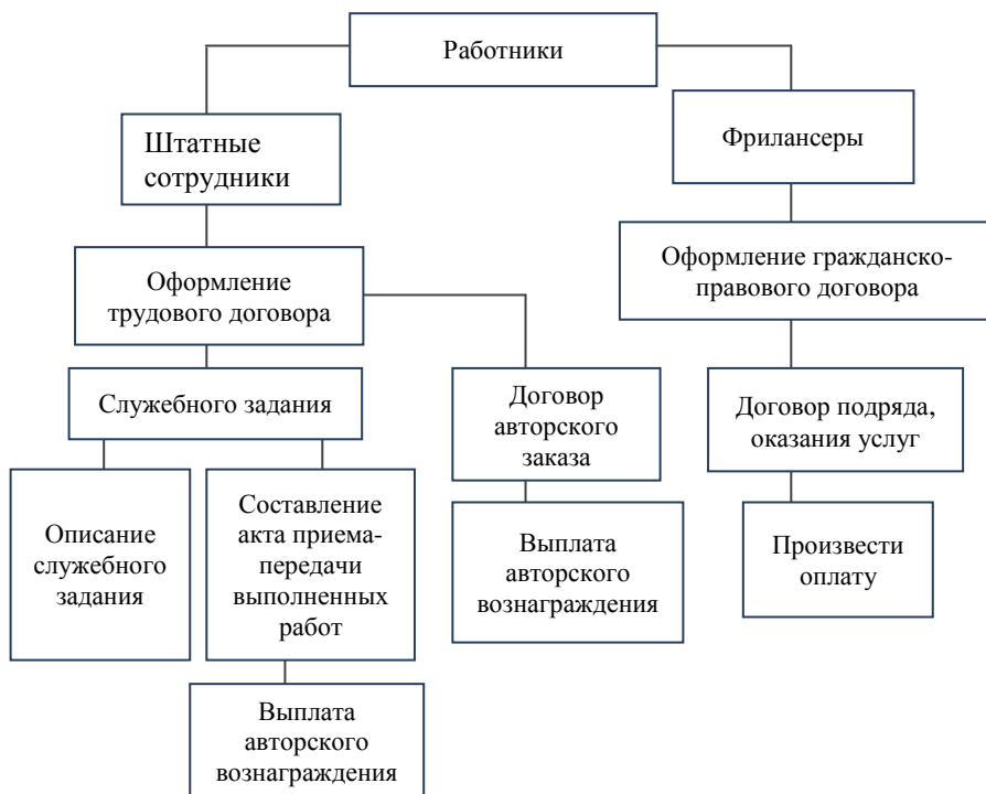
Рисунок 3 Взаимоотношения между администрацией организации и сотрудниками.

Особенности взаимоотношений между администрацией организации и штатными сотрудниками, а также «фрилансерами» можно рассмотреть на рисунке 3.