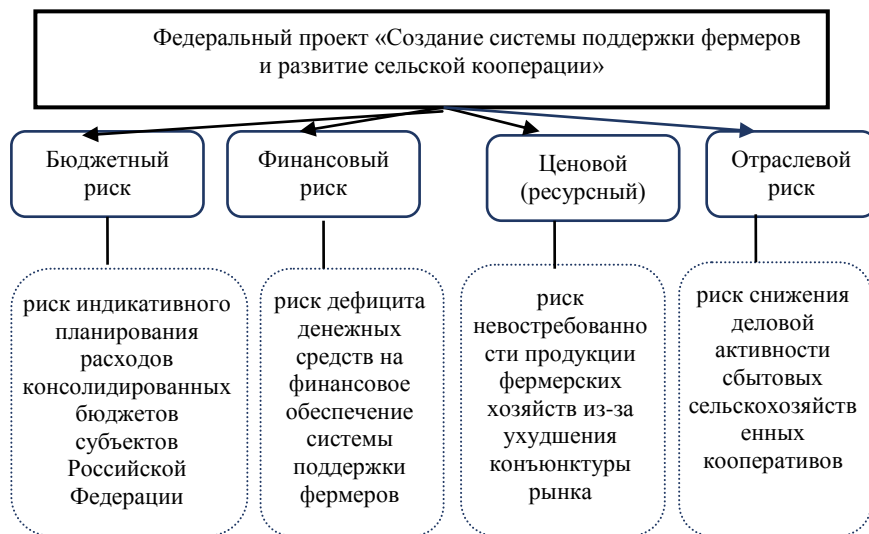
Рисунок 2 – Идентификация и систематизация возможных рисков для федерального бюджета в ходе выполнения федерального проекта «Создание системы поддержки фермеров и развитие сельской кооперации»

Развитие фермерства и сельскохозяйственной кооперации в Российской Федерации сопровождается совершенствованием действующей нормативно–правовой базы, направленной, в том числе, на усиление контроля по соблюдению кооперативных правил и принципов, расширением мер государственной поддержки, увеличением объемов финансирования, разработкой мер, направленных на улучшение организационного, информационного и методического обеспечения деятельности фермеров и сельскохозяйственных кооперативов.