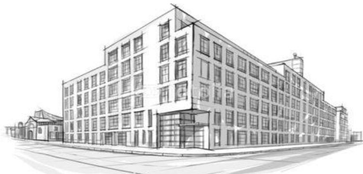
Рис. 1 – Эскиз здания аграрного колледжа

Стоимость строительства составит примерно 2,5 млрд. рублей. Фактически, планируется создать высокотехнологичный учебный комплекс, который позволит решить современные системные проблемы аграрного образования. Главной особенностью является возможность изучения теории на практике, благодаря постройке опытных теплиц, которые одновременно будут служить бизнес-инкубатором.