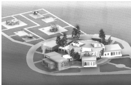
Рис. 1 – Варианты застройки