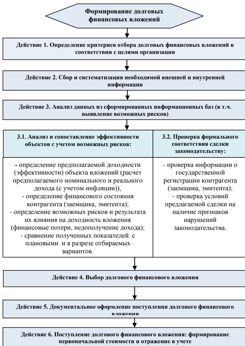
Рисунок 1.- Процедура формирования долговых финансовых вложений